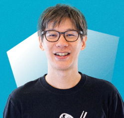
上町家守舎 (花巻市)