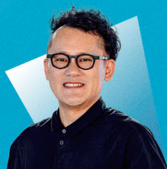
稲とアガベ (男鹿市)

小友木材店をはじめ異業種6社を東京と岩手で経営。リノベーションまちづくりを学び、マルカン百貨店の再生などに取り組む。