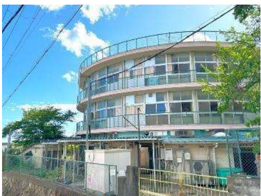
神戸市立美野丘小学校