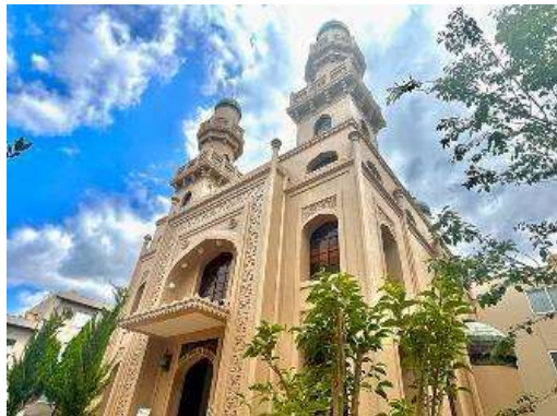
神戸ムスリムモスク