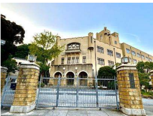
兵庫県立神戸高校