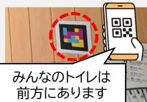
みんなのトイレは前方にあります