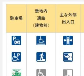
バリアフリー情報の公表