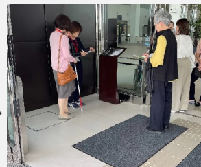
チェック&アドバイス