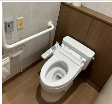
一般便所にも非常ボタン・手すりあり