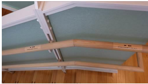
点字付きの2段手すり