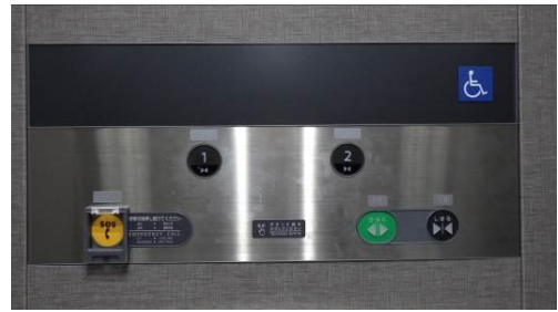
浮き文字式で手触りが分かりやすいボタン