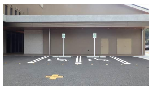
車椅子利用者用駐車区画とは別にゆずりあい駐車場を設置することで利用者を分散