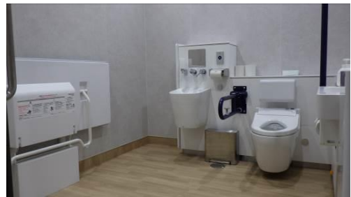
大型介助ベッド・オストメイト洗浄機等機能が充実した多機能トイレ