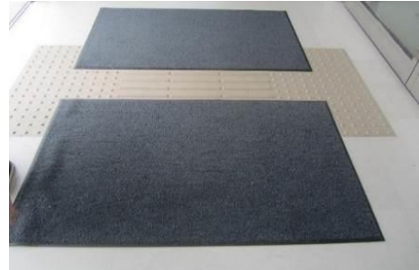
2段階の警告ブロックと点字ブロックを避けた外部出入口の足ふきマット整備