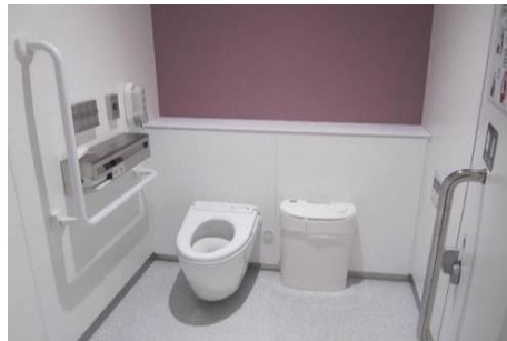
広く手すり付きの一般トイレの個室