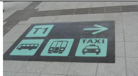
大型のサインと路面のサイン表示で、分かりやすく案内されている。