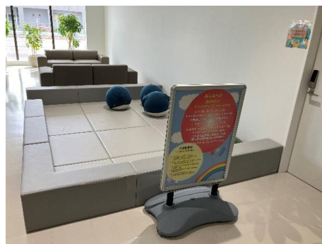
搭乗待合室のキッズスペース