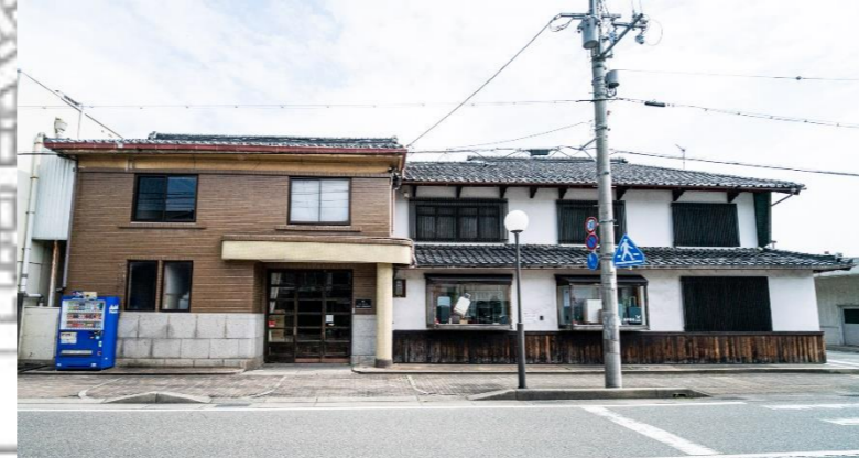
⑩エンドー鞆本社社屋 昭和前期に建てられた木造2階建ての事務所兼住宅。タイル張りの洋風意匠の事務所棟と防火的な外装（外壁漆喰塗り、袖卯建の銅板張り）を施した和風意匠の住居棟が一体に立ち並ぶ構成は、震災復興期における豊岡の商家建築にみられる特徴である。