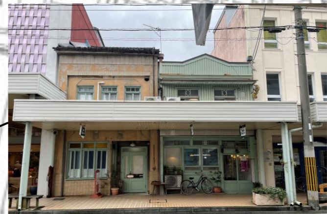
⑮衣川クリーニング店（木造建築） 昭和前期に建てられた木造2階建ての店舗。関東大震災後に流行した通りの正面に防火目的の不燃素材を用いてファサードを洋風に仕立て上げた「看板建築」の特徴を持つ。