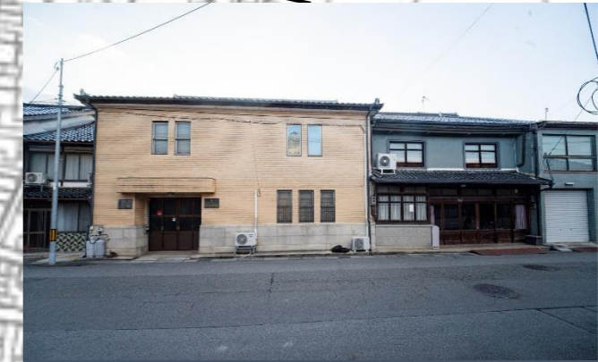
⑰旧木和田商店社屋 昭和前期に建てられた木造2階建ての事務所兼住宅。⑩と同様、洋風と和風の意匠の棟が一体的に立ち並ぶ豊岡の復興期における商家建築にみられる特徴を持つ。建物全体の腰回りを石張りとし、住居棟の袖卯建の端部が銅で被覆されているなど防火性能のある外装が特徴。