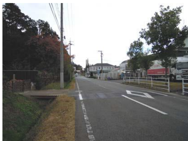
地区南端の市道春日神社北線より西方面を望む