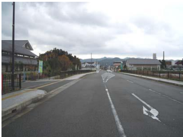
大手線より南方面を望む