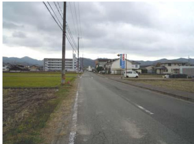
城西線より南方面を望む