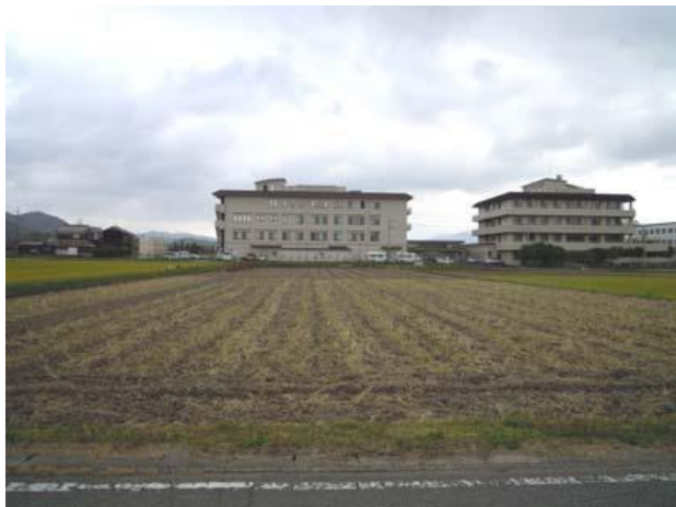
城西線より地区中央部のささやま医療センターを望む