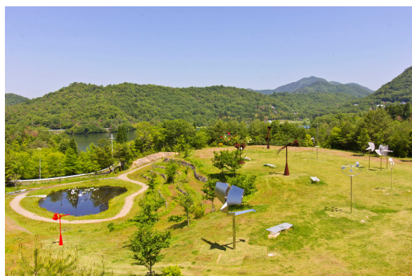
風のミュージアム