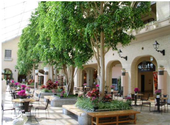
オアシス館（アトリウム）