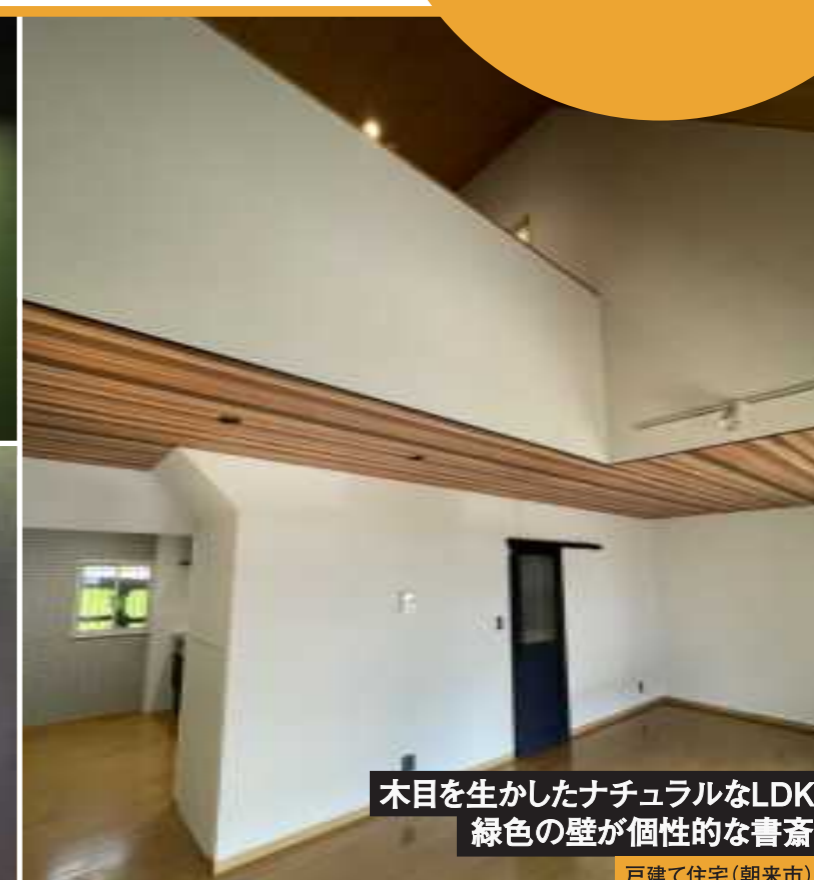
木目を生かしたナチュラルなLDK 緑色の壁が個性的な書斎