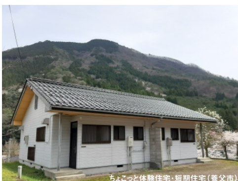
ちよこつ体験住宅・短期住宅(養父市)

*県でも県営住宅の空き室を使ったお試し住宅を県内各地に設置しています。 (兵庫県公営住宅管理課 TEL: 078-230-8470)