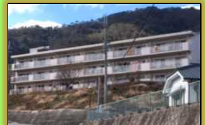
大河内新野鉄筋住宅