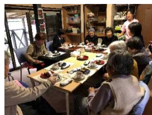
【認知症カフェの活動】