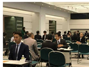
【大学と北播磨地域企業との就職情報交換会】