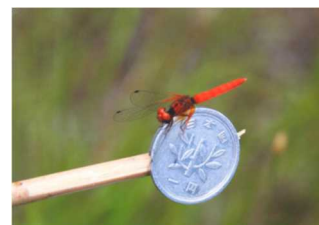
【ハッチョウトンボ】