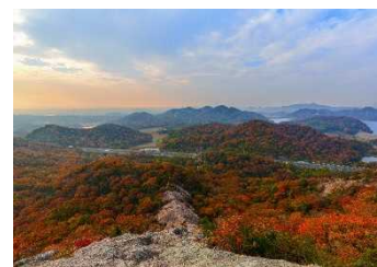
【H30年度“ふるさと北播磨” 写真コンテスト最優秀作品】