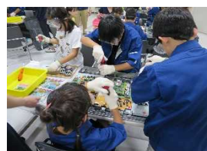
【昨年のツアーの様子】