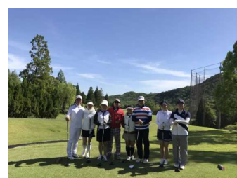
【海外からの旅行者】