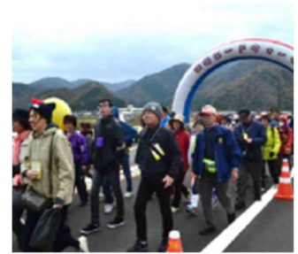
【ウォークイベント（イメージ）】