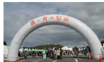
【今年の『北播磨「農」と「食」の祭典』の様子】