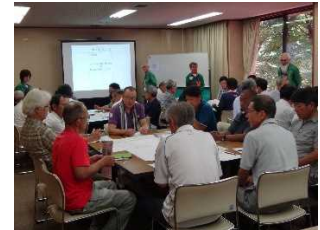
【昨年の研修の様子】