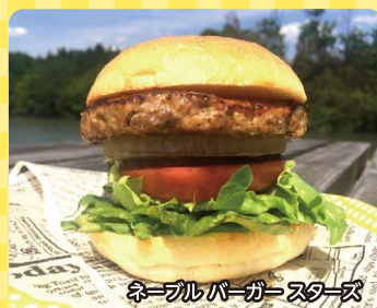
ネーブルバーガー スターズ