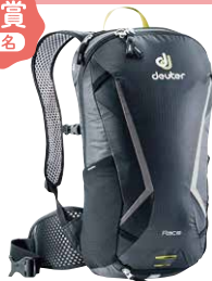
【ドイター】サイクリングリュック