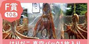
はりだこ 真空パック1枚入り

*商品画像はイメージです。 *場合によっては、商品が変更になる場合がございます。予めご了承ください。