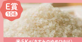
米5Kg(きすみのゆめひかり)