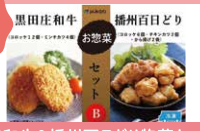
黒田庄和牛&播州百日どり惣菜セット