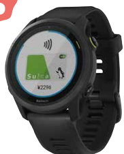
【GARMIN】スマートウォッチ