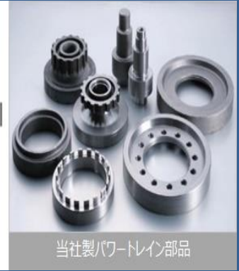
当社製パワートレイン部品