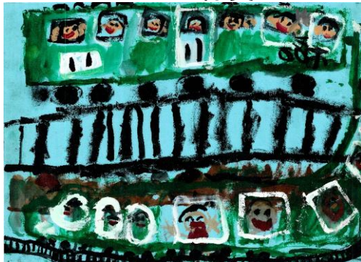
「でんしゃにのって どこまでも」 おざき かなめ 尾崎 要 (日岡保育園 年長)