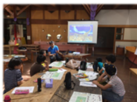
出展 丹波地域恐竜化石フィールドミュージアム