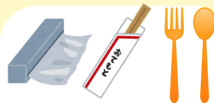
調理用品・使い捨て用品