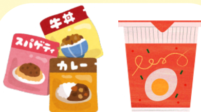
レトル食品・インスタント食品