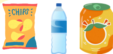
菓子類・水等の飲料