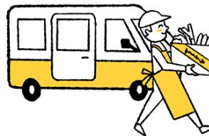
回収・点検・分配 社協、フードバンク等