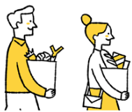
食品の寄付 消費者