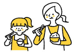
必要とする人々へ 子ども食堂・福祉団体等