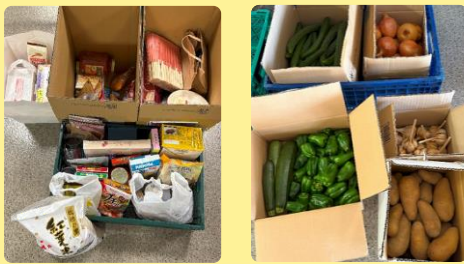
寄付いただいている様子