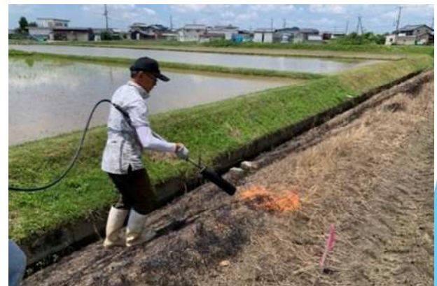
畔焼き作業 (枯草・株・落下種子を焼却)