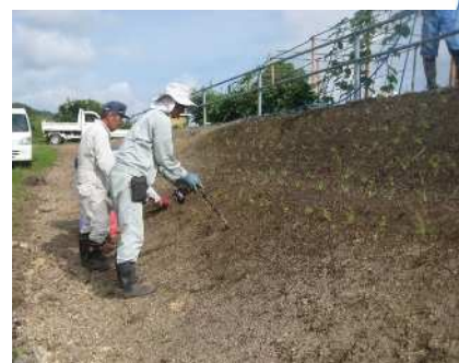
法面が固いため、アースドリルを使用