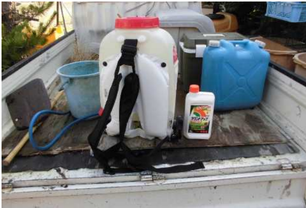
グリホサート系非選択性茎葉処理剤