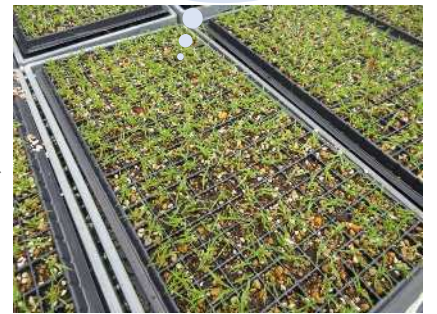
(R6.5.31撮影) 播種から1.5か月が経過