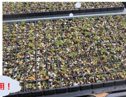
(R6.5.16撮影) 播種から1か月が経過