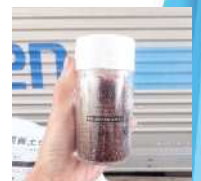
塩コショウ容器 (100円程度)