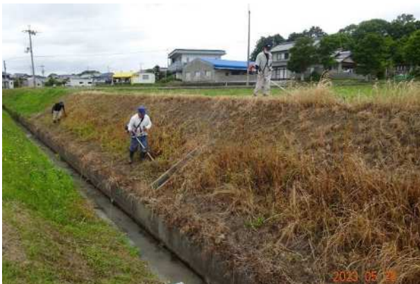
枯草の刈払い作業 (地際で短く)