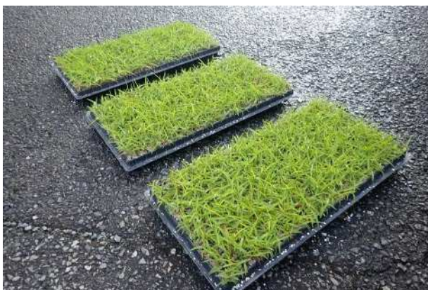
市販ピット苗 (200本/トレイ)