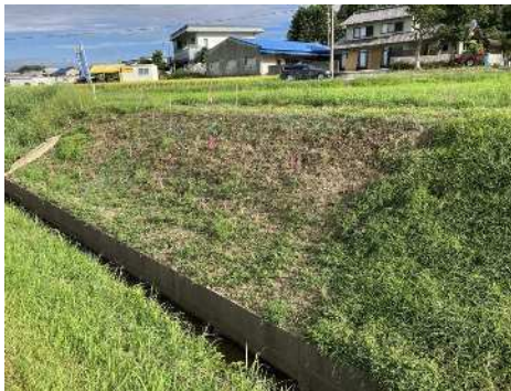
(R5.8.30撮影) 自家製張芝を追加で補植