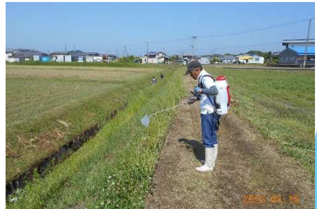
散布状況 (往復散布により双方向から満遍なく)