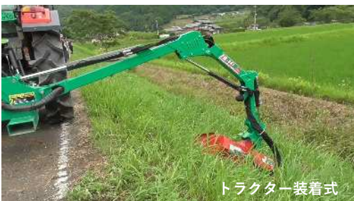
トラクター装着式