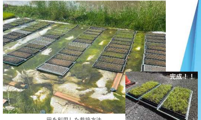
田を利用した栽培方法