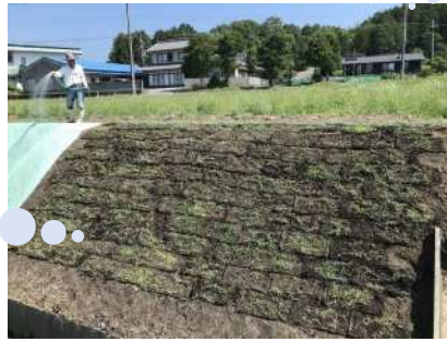
(R5.6.17撮影) 自家製張芝施工（張芝全面張り）

「全面張り」以外にも 「市松張り」や「法肩のみに敷設」 する方法も！ 資材費が安価に施工できます