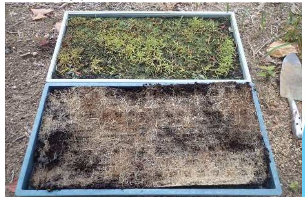
自家製張芝裏面の根張り状況