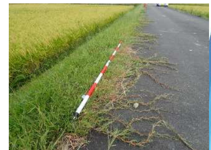
地上ほふく茎(ランナー)が 放射線状に伸び、被覆を上げていく