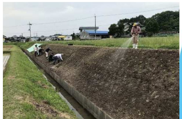
移植直後の散水状況

✓ パイプライン給水栓の活用など軽労に散水できる環境であれば、被覆完成を促進するための散水も有効です（完成を前倒しできれば、以後の雑草管理期間が短縮されるため）