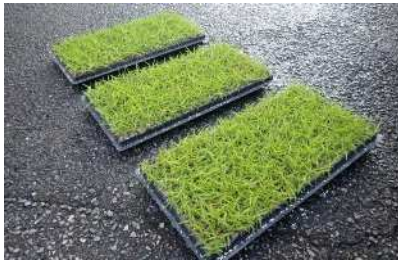
市販ピット苗 (200本/トレイ)