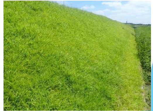
(R7.7.10撮影) 施工から2年後しっかりと効果を実感