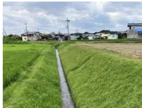
(R6.7.31撮影) 他の工法との境が分からないほどに被覆