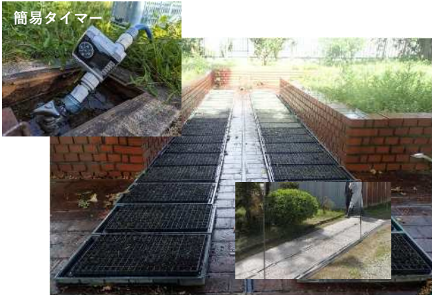
簡易タイマーと散水チューブによる自動散水