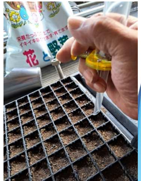
野菜用種まき器を使った播種作業

A3 育苗箱1枚につき1gが適量 です。 密植するとほふく茎の伸びが悪くなり、被覆が遅れます。