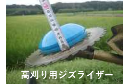
高刈り用ジズライザー