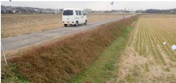
(R5.12.7撮影) 直近の高刈りから4ヶ月が経過