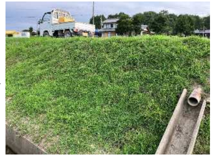
(R5.7.29撮影) ランナーが法面を覆いつくす