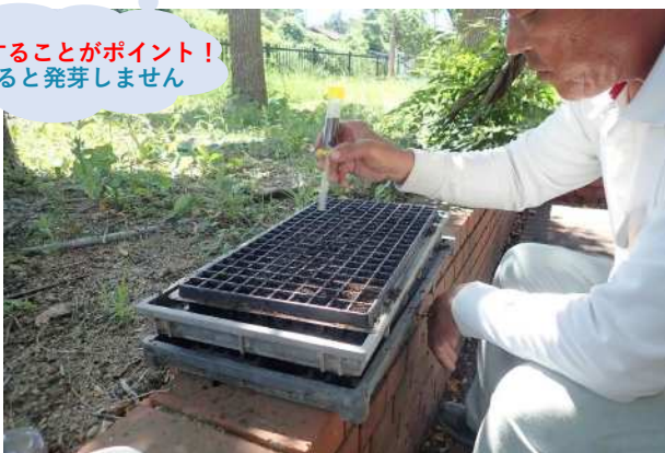
播種作業 (野菜用種まき器使用)