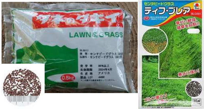
センチードグラスの種子 (左：緑化用・500g入/袋) (右：ブランド品種・20ml入/袋)

※ 農林水産省登録品種は種子購入者の自家利用に限定されており、増殖された種苗を許可なく譲渡(有償、無償に関わらず)することは禁じられています