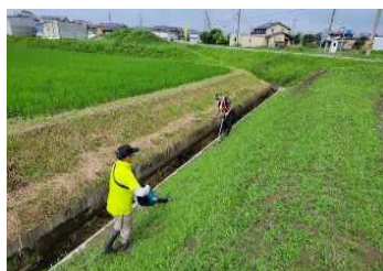
(R6.7.17撮影) 初めての高刈を実施 その後、R6は雑草が大きくなれば高刈を実施