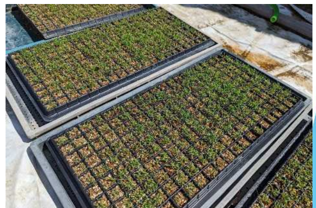
発芽状況 (1セルに5本程度が目安)