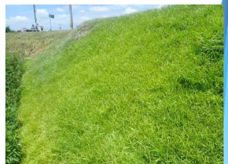
(R7.7.10撮影) 7月時点でR7高刈0回