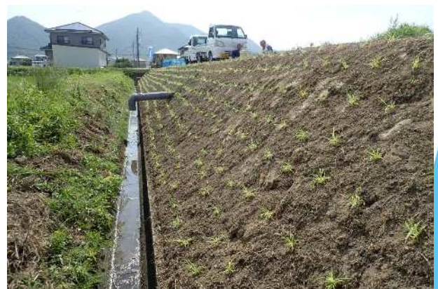
苗定植完了（30cm間隔・千鳥配置）

※9月下旬以降（年内）に定植した場合は、冬までに根茎が十分に生長することができず、越冬することができない可能性があります