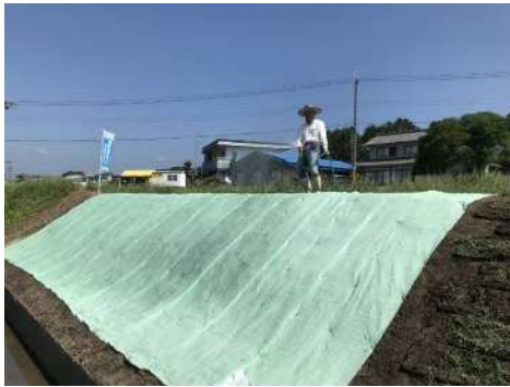
(R5.6.18撮影) シートが浮かないように5cm程度重ね合わせて敷設し大頭釘を50cm間隔で設置