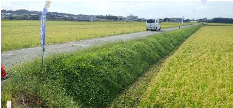
(R5.9.16撮影) R5.8.8に高刈りを実施して以降、真夏に1.5ヶ月間放置した法面状況