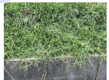
(R6.9.5撮影) ランナーが垂れるまで生長