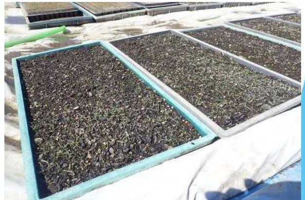
発芽状況（播種後20日目）