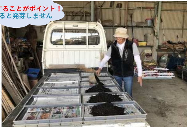
培土の敷き均し作業（育苗箱下に新聞紙を敷く）