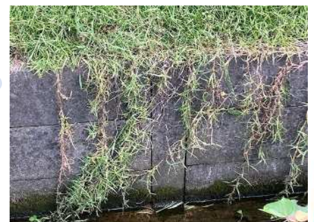
ほふく茎が水路に垂れ下がるようす

※ 農林水産省登録品種は種子購入者の自家利用に限定されており、 増殖された種苗を許可なく譲渡(有償、無償に関わらず)することは禁じられています