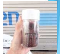
塩コショウ容器 (100円程度)