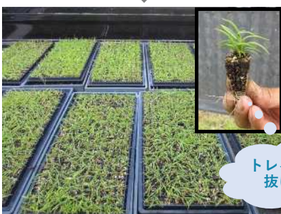
(R6.6.16撮影) 2か月で自家製ピット苗完成