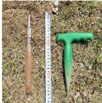
植え穴掘り具（左：金属棒、右：野菜用）