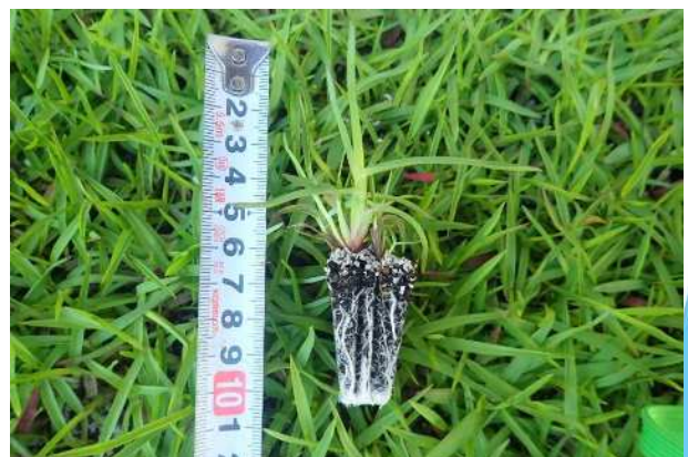
ピット苗寸法 (土部分は2cm四方×高さ4cm)