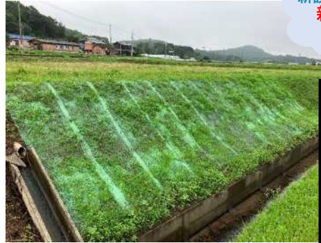
(R5.7.10撮影) 雑草の生長が早いためセンチピードグラスの種子が着床する前に雑草がシートを持ち上げてしまう