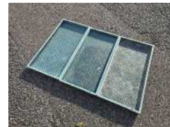
水稲用育苗箱(倉庫の未使用品)