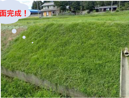
(R5.9.6撮影) 施工から3か月が経過