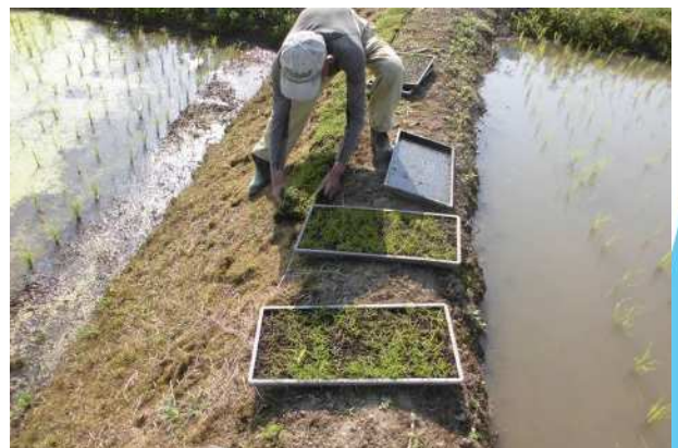
自家製張芝の敷設作業