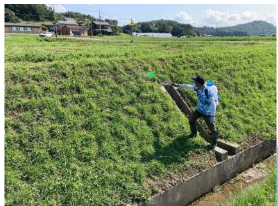
選択性除草剤「2,4-Dアミン塩」の散布状況