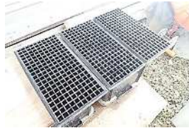
セルトレイ (200円程度/枚)