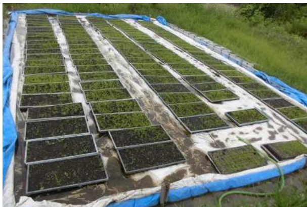
苗床プールで管理（箱下1cm程度を浸水させる）