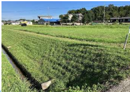
(R5.8.28撮影) ランナーが生長し法面を被覆