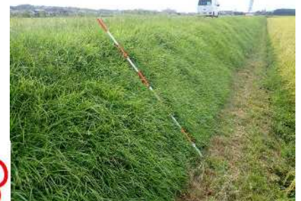
センチピードグラスが被覆した農道法面 (草丈はこれ以上高くない)