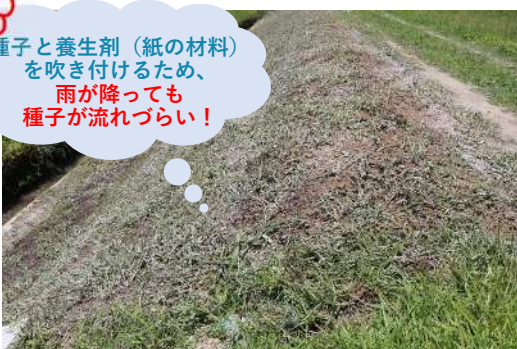
(R6.6.12撮影) 専門業者に委託し種子吹付を実施