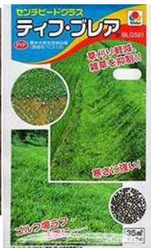
センビードグラスの種子 (左:緑化用・500g入/袋) (右:ブランド品種・20ml入/袋)