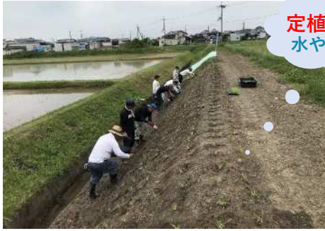
(R5.6.18撮影) 市販ピット苗定植

市販ピット苗の購入方法はp-10を 定植方法はp-17～p-19をご覧ください♪