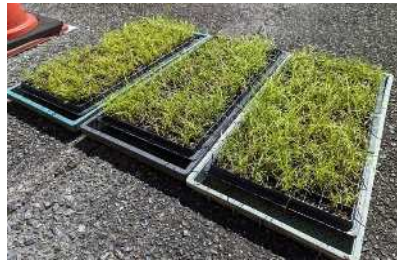
自家製ピット苗 (200本/トレイ)