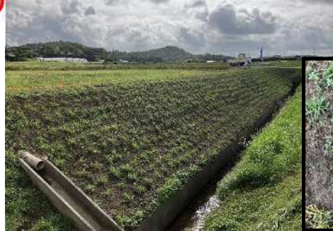
(R5.7.10撮影) 苗からランナーが伸び始める