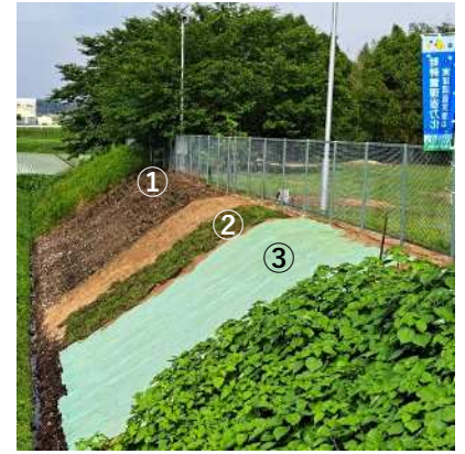
奥から①「市販ビット苗工法」 ②「自家製張芝工法」③「植生シート工法」

A15 放置すると蒸れてセンチピードグラスが枯れる原因となります。 可能であれば、 高刈後の雑草を撤去する ことが望ましいですが、 難しい場合は 細かく裁断してプロアで散らす 等の対処が必要です。