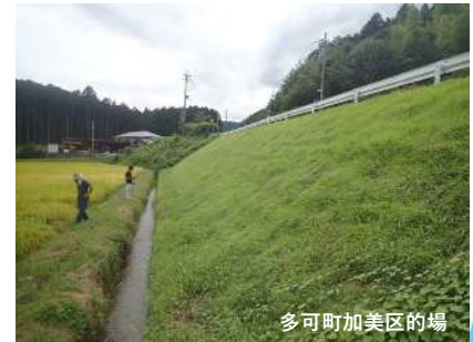
多可町加美区的場