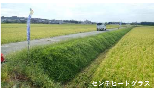
センチピードグラス