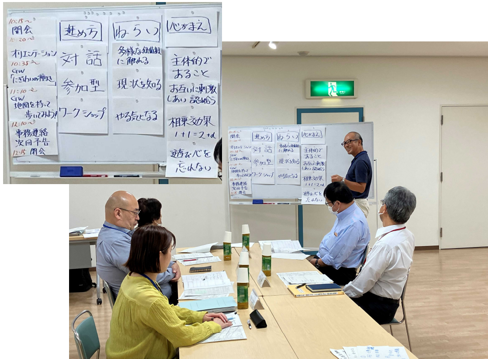
余部座長の進行 協議会の進め方、ねらい、心がまえ