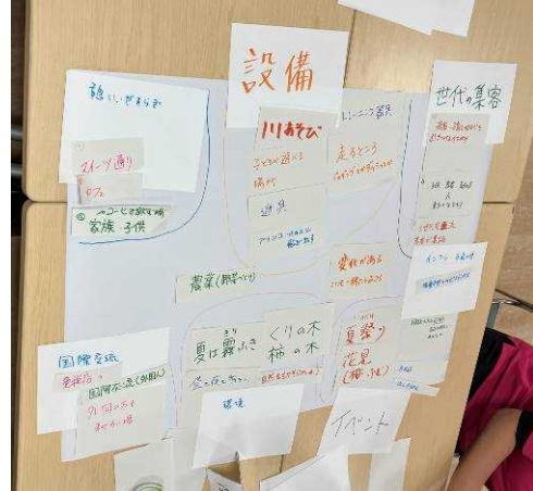
グループワーク「にぎわいの種まき」