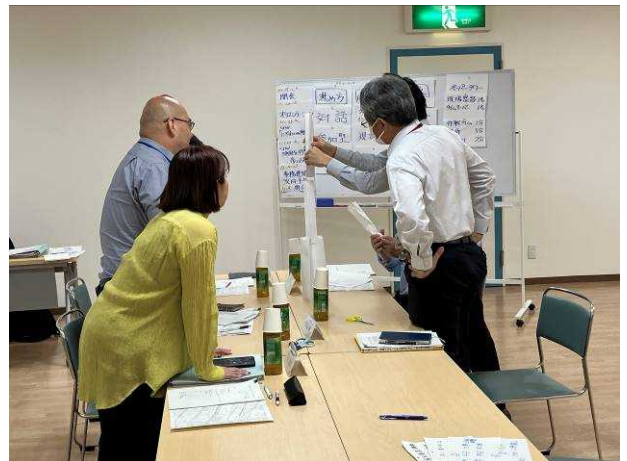
アイスブレイク「ペーパータワー」