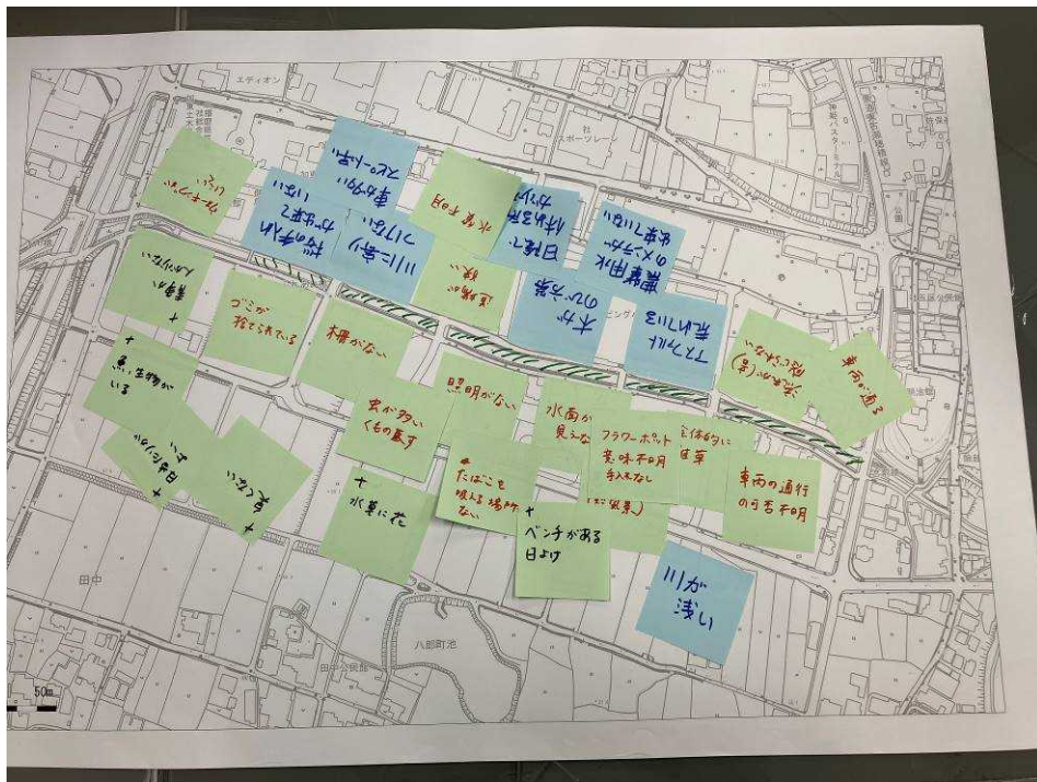
グループワーク「地図を持って歩いてみよう」にぎわいを阻害するもの

やしろショッピングパークBio東端橋梁から、社総合庁舎東端のふれあい橋までグループ毎に歩いて、現状で「にぎわいを阻害するもの」「人が集まりにくくしているもの」を抽出した。事前の留意事項として、座長から、「気付いたことを全部言うこと」、「五感を全部使うこと」、「質より量が大事」、「自由(これを言ったらダメかな、はなし)」、「人の言うことを批判しないこと」、「人の意見に便乗OK」等の説明があった。