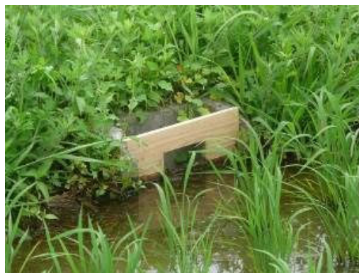
【田んぼダム：田んぼダム用セキ板の設置】