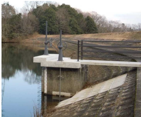
【ため池：オリフィスの改良工事】