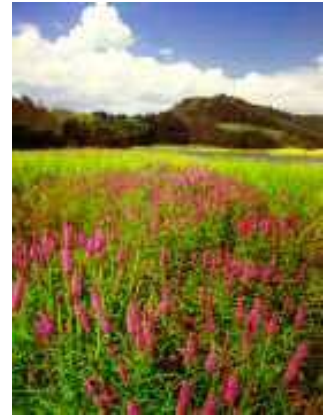
ミズトラノオの群生