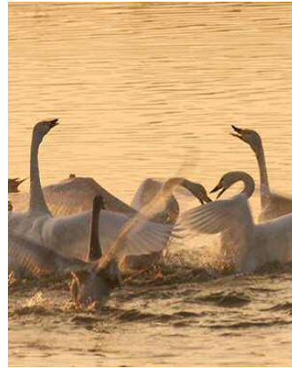
コハクチョウの群れ