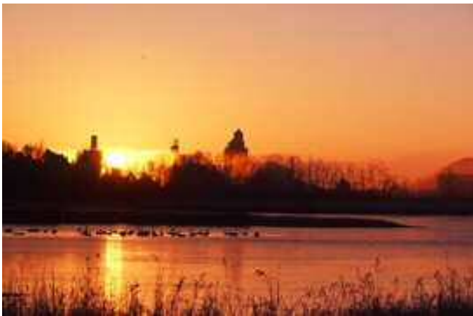
冬の長倉池（日の出とコハクチョウ）