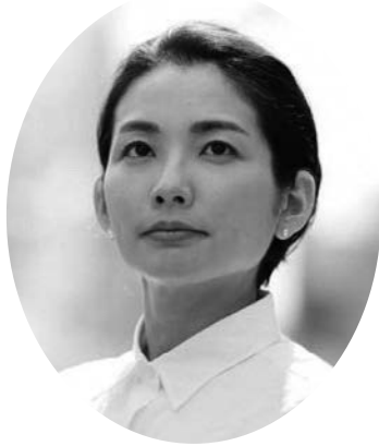
講師プロフィール