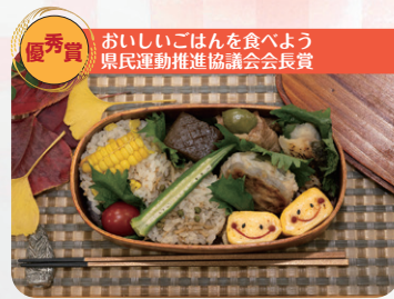
優秀賞 おいしいごはんを食べよう 県民運動推進協議会会長賞