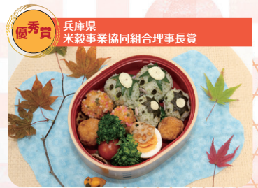
優秀賞 兵庫県 米穀事業協同組合理事長賞