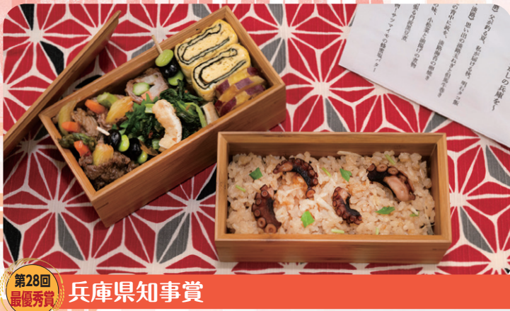
第28回 最優秀賞 兵庫県知事賞