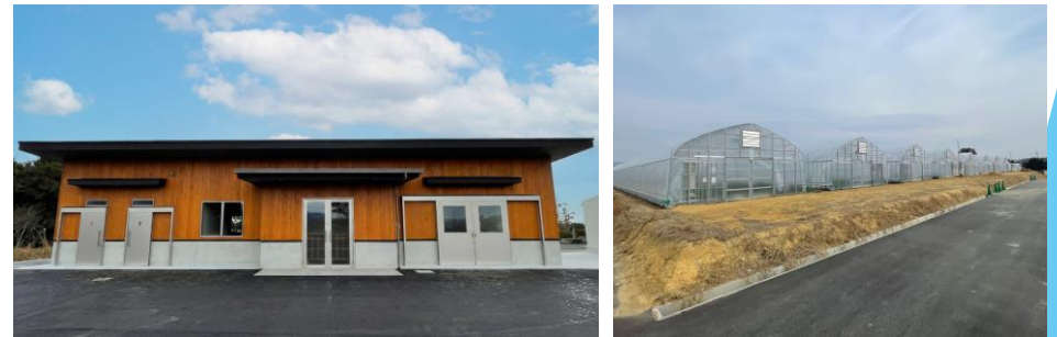
有機農業アカデミー（教育棟、露地ハウス）

有機専業以外にも、慣行農業と有機農業を組み合わせた経営や、農福連携によるユニバーサルな農業や、半農半Xなど農業以外の事業にも従事する人との連携推進により、多様なかたちで有機農業を拡大