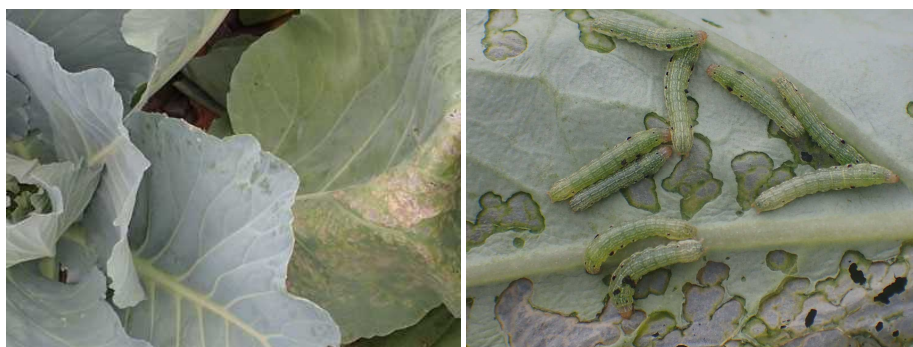
写真3 ハスモンヨトウによるキャベツ被害葉