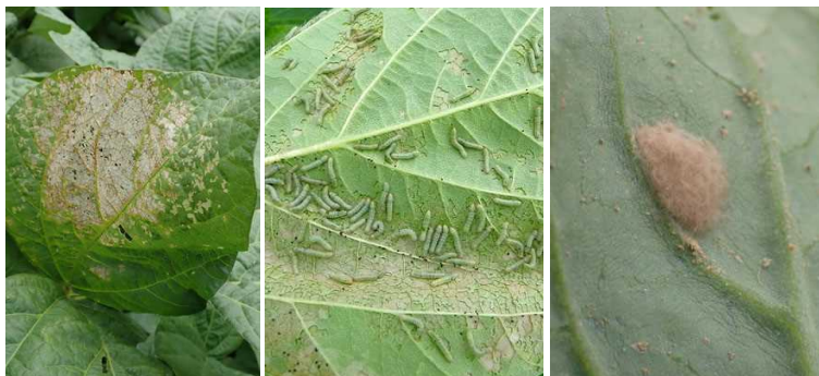
写真1 ハスモンヨトウ