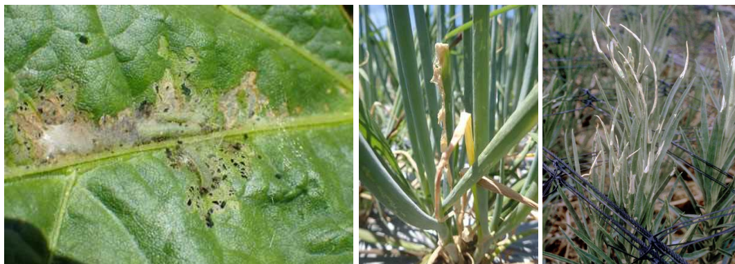
写真4 シロイチモジヨトウによる被害葉