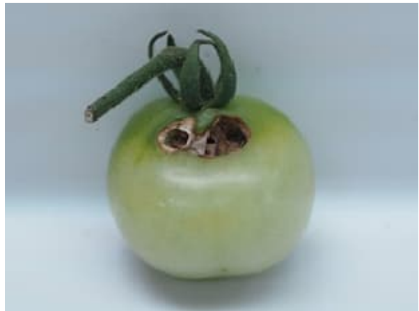
写真2 オオタバコガによる食害（左：キャベツ結球部、右：トマト果実）