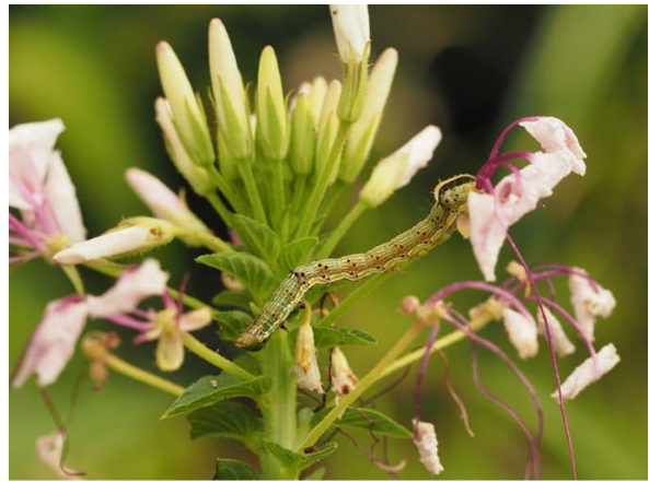
写真1 オオタバコガ幼虫（左：若齢幼虫、右：老齢幼虫）