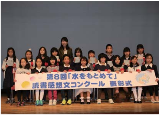
受賞者のみなさん

3月5日、明石市民会館で催された「親子疏水学習会」に、約500名の児童・保護者や学校関係者が参加しました。「ため池保全県民運動」の一環として、疏