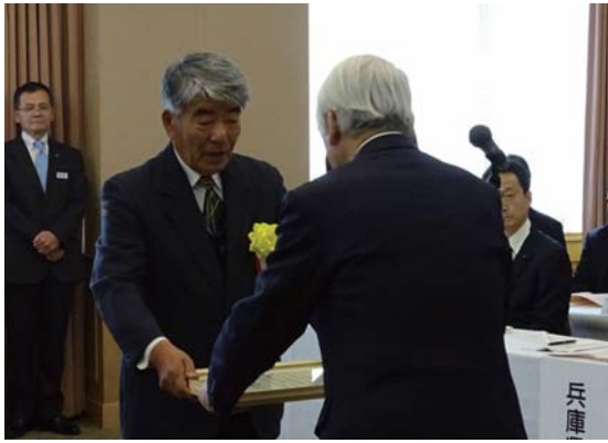
感謝状を受け取る代表者

兵庫県では、昭和55年度より、ため池管理者に対し、農業用ため池の適正な管理及び多面的機能の発揮の促進に努め、地域住民の安全と農業農村の振興への