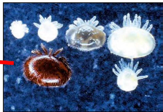
ミツバチヘギイタダニ