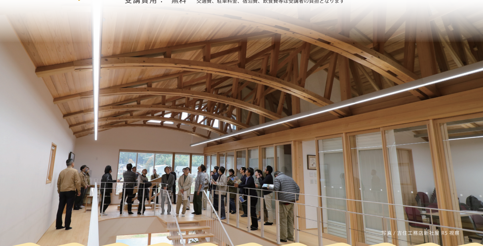
写真 / 吉住工務店新社屋 R5 視察

対象・定員： 兵庫県内の 林業・製材・プレカット工場・木材流通・施工等に関わる実務者 10名程度 申込〆切： 8/30 (金) 17:00 定員を超えた場合は選考となります 受講費用： 無料 交通費、駐車料金、宿泊費、飲食費等は受講者の負担となります