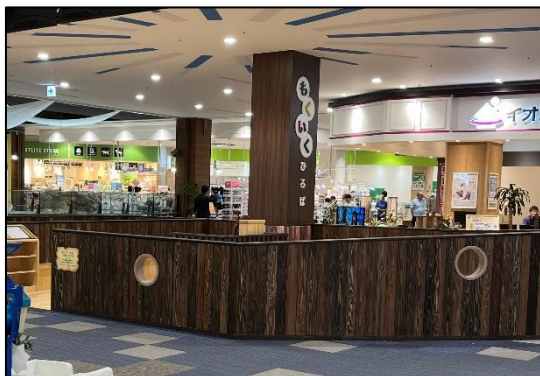
イオンモール神戸 (神戸市) (①室内木質化・③木製品導入)