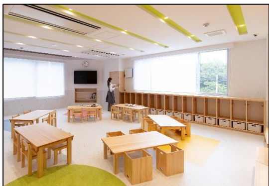
セイバンスマイルこども園 (西宮市) (③木製品導入)