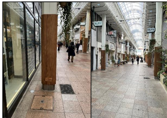
三宮本通商店街アーケード(神戸市) (②屋外木質化)