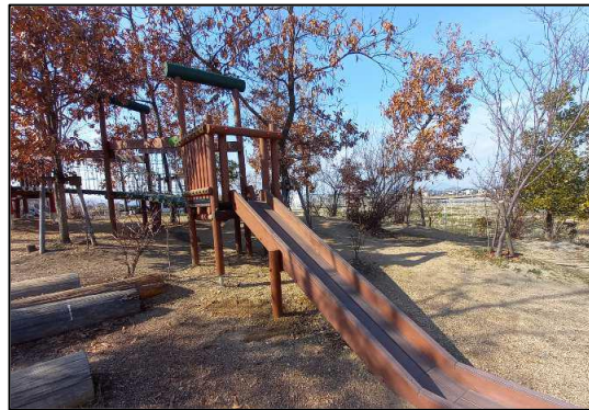
瑠璃こども園(姫路市) (③木製品導入)