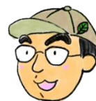
“葉っぱはかせ” 小館研究員

まずは先生方が遊んでみて、 子どもたちにつなげて、 そこからそれぞれの園ならではの 活動にチャレンジしていただければ 嬉しいです。