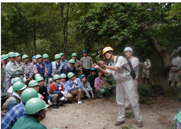
専門家による技術指導