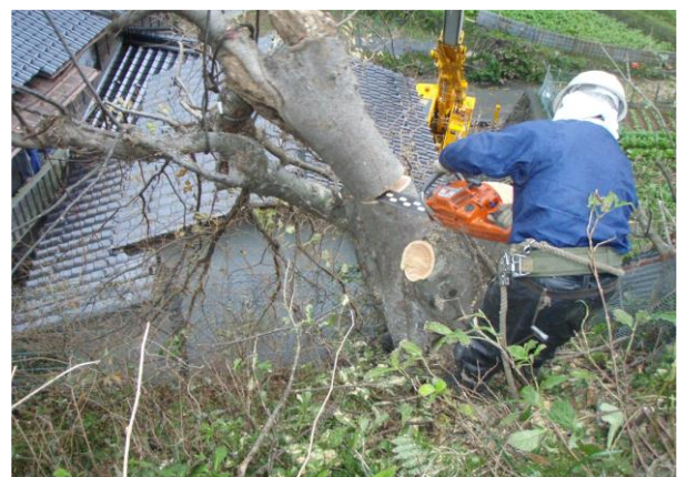
人家裏の危険木の伐採(委託)