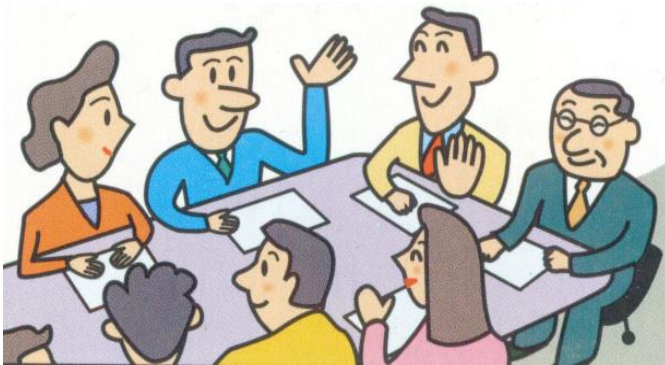
住民参加による計画づくり