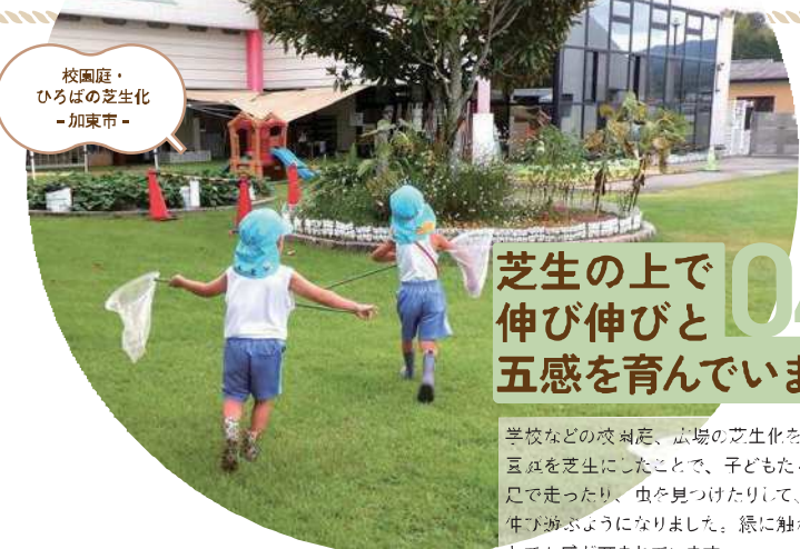
校庭・ひろばの芝生化 -加東市-