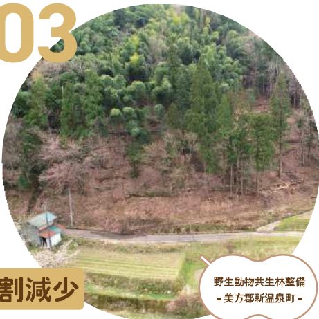
野生動物共生林整備 -美方郡新温泉町-

野生動物による農作物被害が深刻な農地で、人と野生動物の棲み分けを図るバッファゾーンの設置や、シカの食害等で元腐した森林に保護柵を設置して被害を回復させます。兵庫県北地区では、6~8割の農地でシカ・イノシシ等による被害が軽減または減少しています。