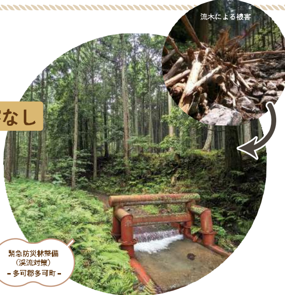
緊急防災林整備(溪流対策) -多可郡多可町-

山地災害の危険性が高い溪流で、流入による被害を軽減するため、災害緩衝林整備や簡易防災施設を設置します。これまでに整備した箇所では、豪雨後に流入等の大きな被害が発生していないことを確認しています。