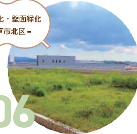
屋上緑化・壁面緑化 -神戸市北区-