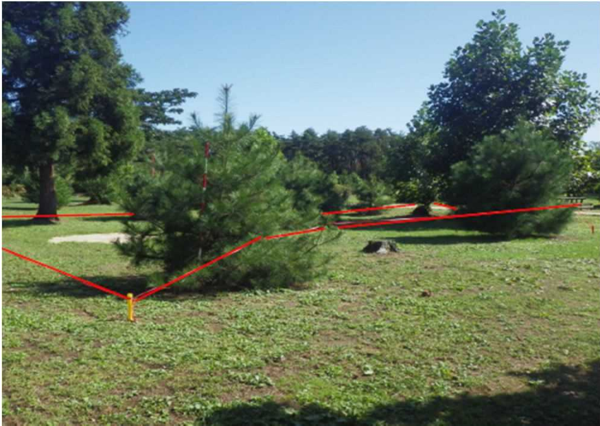
「ひょうご元気松」生育状況確認 豊岡市日高町栗栖野 平成25年度植栽 植栽後6年 樹高2.8m