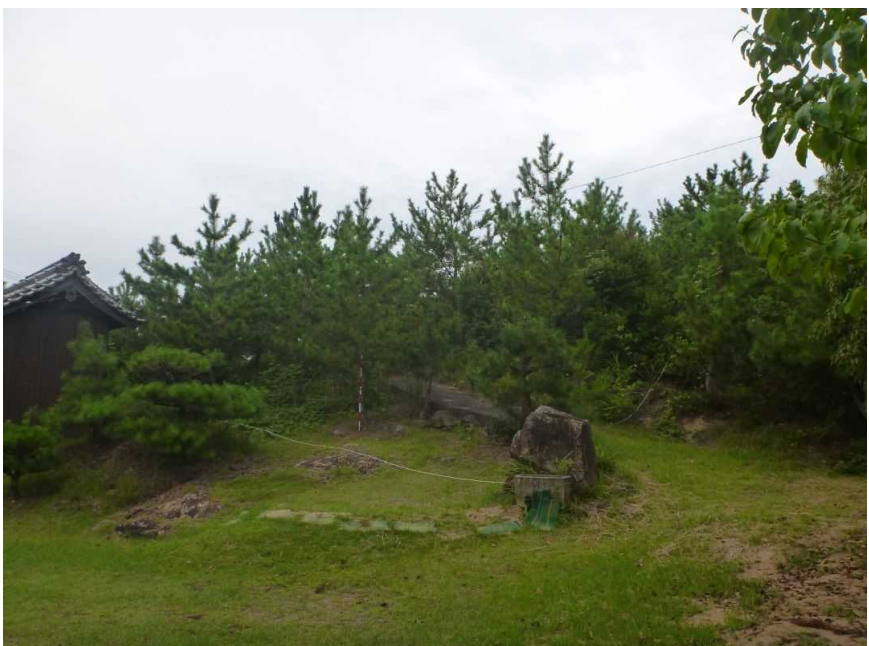
「ひょうご元気松」生育状況確認 加古川市志方町投松 平成21年度植栽 植栽後10年 樹高5.0m