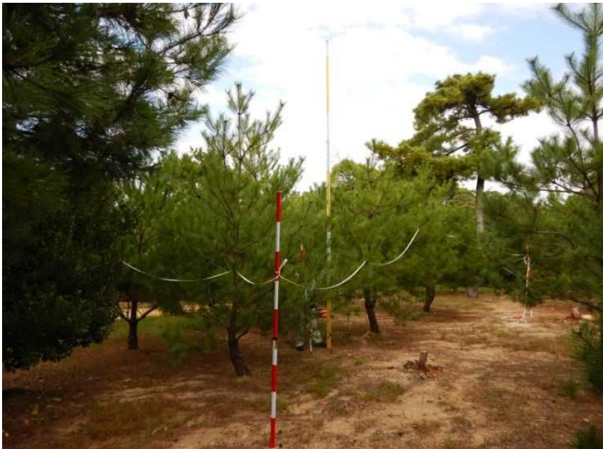
「ひょうご元気松」生育状況確認 神戸市舞子墓園 平成23年度植栽 植栽後8年 樹高3.5m