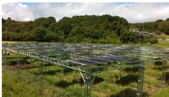
営農型太陽光発電(ソーラーシェアリング) (宝塚市内)