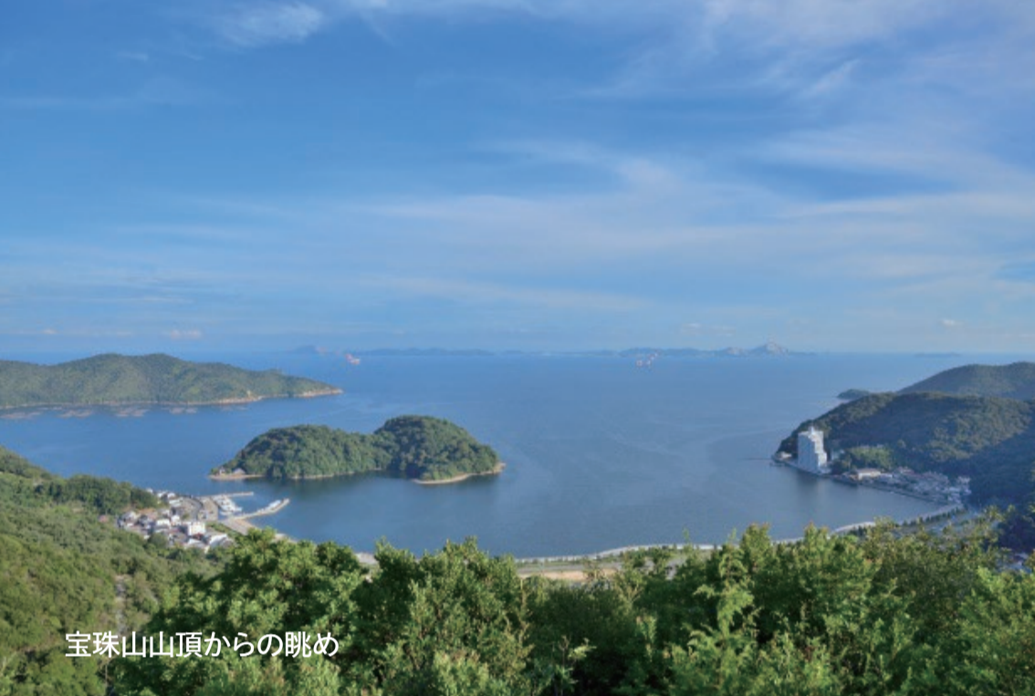
宝珠山山頂からの眺め