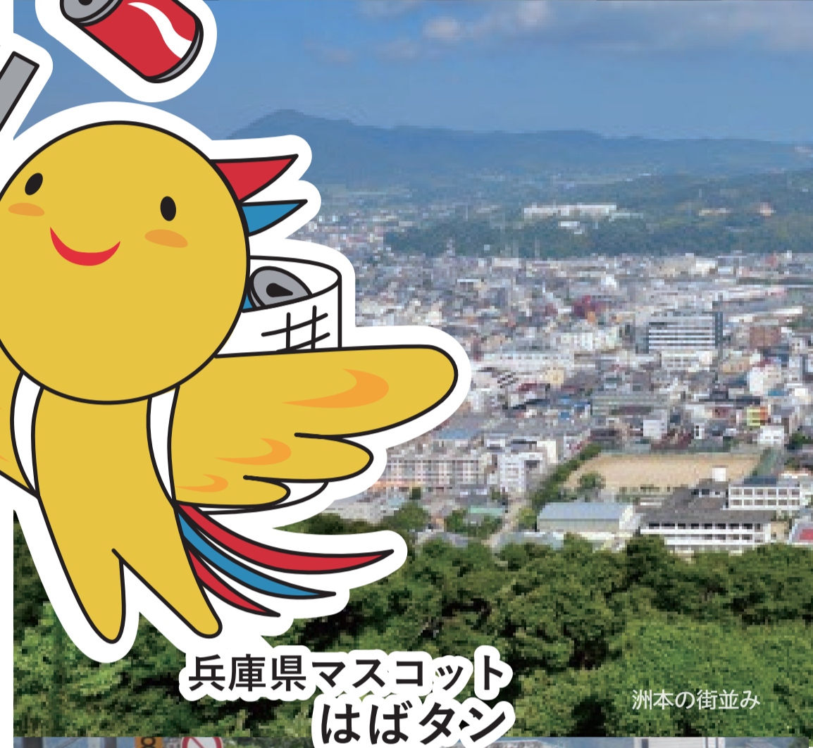
兵庫県マスコット はばタシ