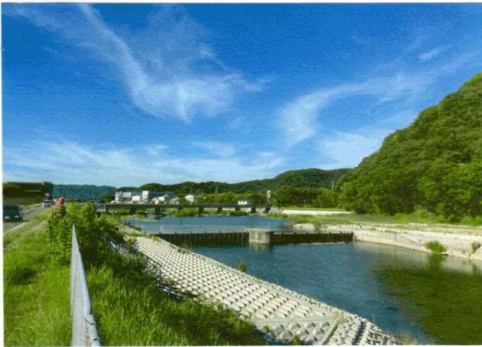
林田川を經由して取水する赤井頭上工(たつの市)