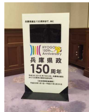
カウントダウンボード