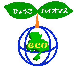
ひょうごバイオマス eco モデル ロゴマーク