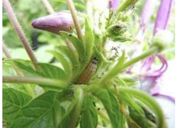
写真2 クレオメに寄生する幼虫 (生長点の食害)