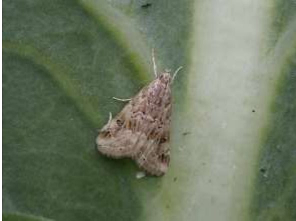
写真1 ハイマダラノメイガ成虫 (体長は約10mm)