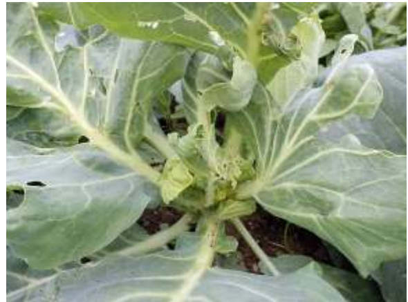
写真4 食害を受けたキャベツ (正常に結球しない)

*この情報は、兵庫県立農林水産技術総合センターホームページに掲載しています。 ( http://hyogo-nourinsuisangc.jp/ )