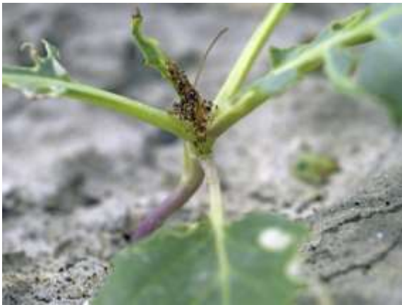
写真3 食害を受けたキャベツ (定植直後)