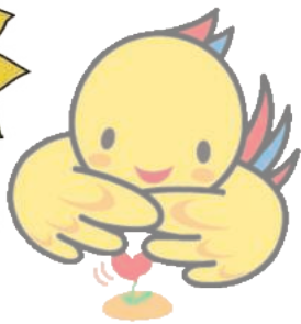
兵庫県マスコット はばタン