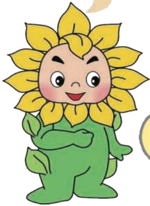
兵庫県弁護士会マスコット ヒマリオン