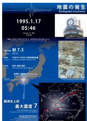
グラフィックパネル