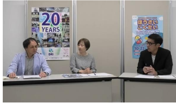
ひとぼうチャンネル（災害伝承ミュージアム・セッション vol. 4 2022 ～日本の災害ミュージアムの現在地～）