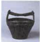
丹波 灰釉手桶形水指 江戸時代前期 兵庫陶芸美術館

近世を迎えると、他の産地と同様に丹波でも茶道具を作り始めます。各時代の茶人に受け継がれ、愛蔵されてきた丹波の茶道具の魅力に迫ります。また、茶室の空間を再現し、県内の窯場で焼かれたさまざまな茶道具を取り合わせて、茶湯の世界の一端を紹介いたします。