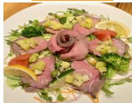
炊飯器で作る鹿ハムのサラダ仕立て～キウイのドレッシングで～