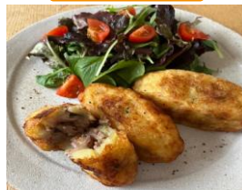
鹿肉のパパレジェーナ