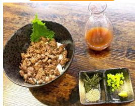
鹿肉のひつまぶし