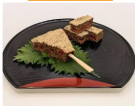
鶉越 —鹿肉の梅入り松風焼—