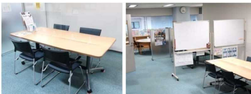
ミーティングコーナー

ひょうごボランティアプラザは、県民ボランティア活動の全県拠点として、ボランティアグループ、NPO等の交流ネットワークの場づくり、活動資金の支援、情報提供や相談等を行っています。また、災害ボランティア活動を支援しています。