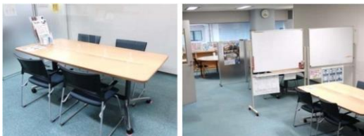
ミーティングコーナー

ひょうごボランティアプラザは、県民ボランティア活動の全県拠点として、ボランティアグループ、NPO等の交流ネットワークの場づくり、活動資金の支援、情報提供や相談等を行っています。また、災害ボランティア活動を支援しています。