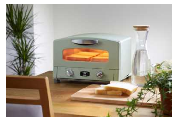
写真：グラファイトトースター