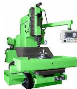
写真：大型スロッターマシン NVS-360

所在地 多可郡多可町中区安楽田5番地 設立 1958年 資本金 2,100万円 従業員数 32名