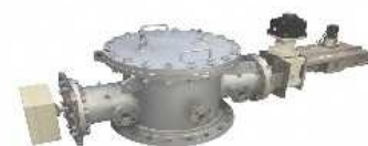
写真：ランスレス高炉3Dプロファイルメータ

所在地 尼崎市名神町1丁目12番9号 設立 1984年 資本金1,000万円 従業員数15名